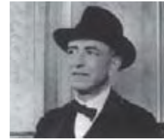
Μανουέλ ντε Φάλλη

Επηρεάστηκε ιδιαίτερα από το ανδαλουσιανό «κάντε χόντο» (cante jondo). Όταν το 1919 εγκαταστάθηκε στη Γρενάδα, συνδέθηκε με φιλία με τον ποιητή Φεντερίκο Γκαρθία Λόρκα.