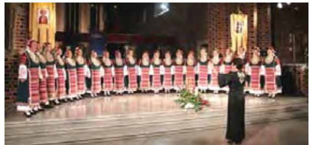
Le Mystère des Voix Bulgares