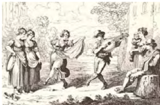
Σαλταρέλλο (Ιταλικός χορός)