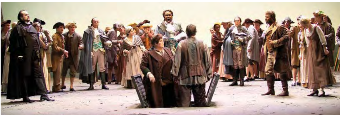
Σκηνή από την όπερα «Φιντέλιο» του Λ. Β. Μπετόβεν

Ο συνθέτης της όπερας συνεργάζεται με το λιμπρετίστα, ο οποίος γράφει το θεατρικό-ποιητικό κείμενο του έργου. Πλήθει τους χαρακτήρες και την πλοκή έχοντας την επίγνωση του δραματικού στοιχείου και επινοεί καταστάσεις τέτοιες που να δικαιολογούν τη χρήση της μουσικής. Το « λιμπρέτο » ( libretto ), το κείμενο δηλαδή της όπερας, πρέπει να συλλογίζεται με φαντασία, ώστε να δίνει στο συνθέτη τη δυνατότητα να δημιουργεί διάφορες μουσικές κατασκευές (άριες, ρετσιτατίβο, ντουέτα, σκηνές συνόλων, χορωδιακά), που συνδέονται παραδοσιακά με αυτή τη μορφή τέχνης.