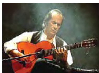
Πάκο ντε Λουθία